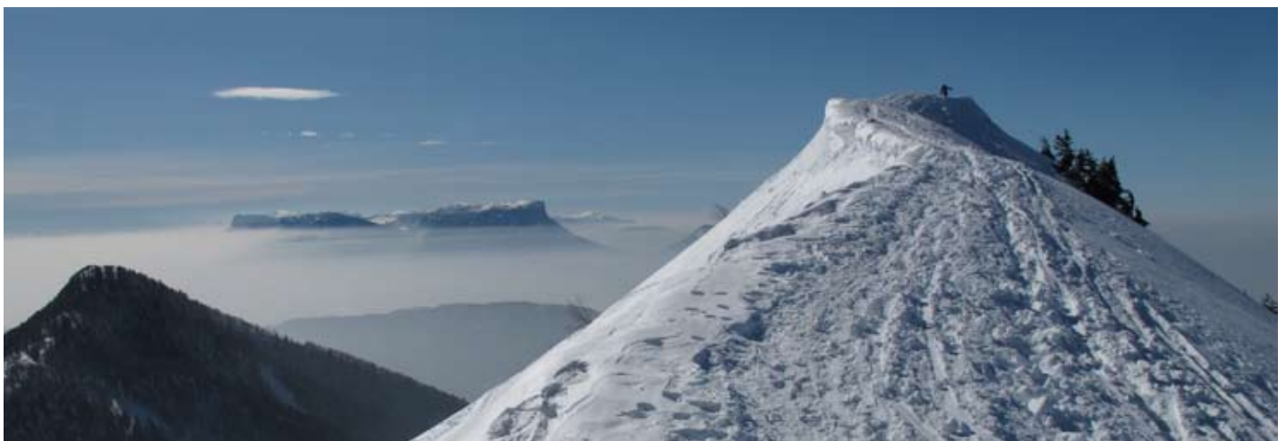
Pointe de la Galoppaz (Bauges)

À noter pour les enfants intéressés par la compétition escalade : un trophée réservé aux poussins et benjamins sera organisé le samedi 6 avril à St-Genest-Malifaux dans la Loire.