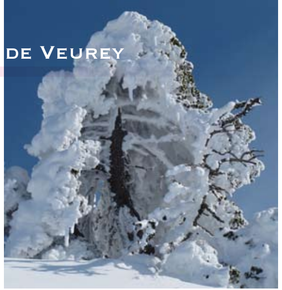
Abominable homme des neiges photographié en montant au Moucherotte

Avril, mai, juin, les mois du printemps pendant lesquels le CMEV propose un évènement particulier.