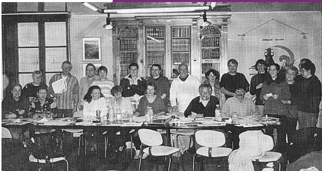
Réunion de réalisation du numéro 100 - Nov 2002

Souvenez-vous, vous êtes peut-être sur la photo, lors de la fabrication du numéro géant de 24 pages ?