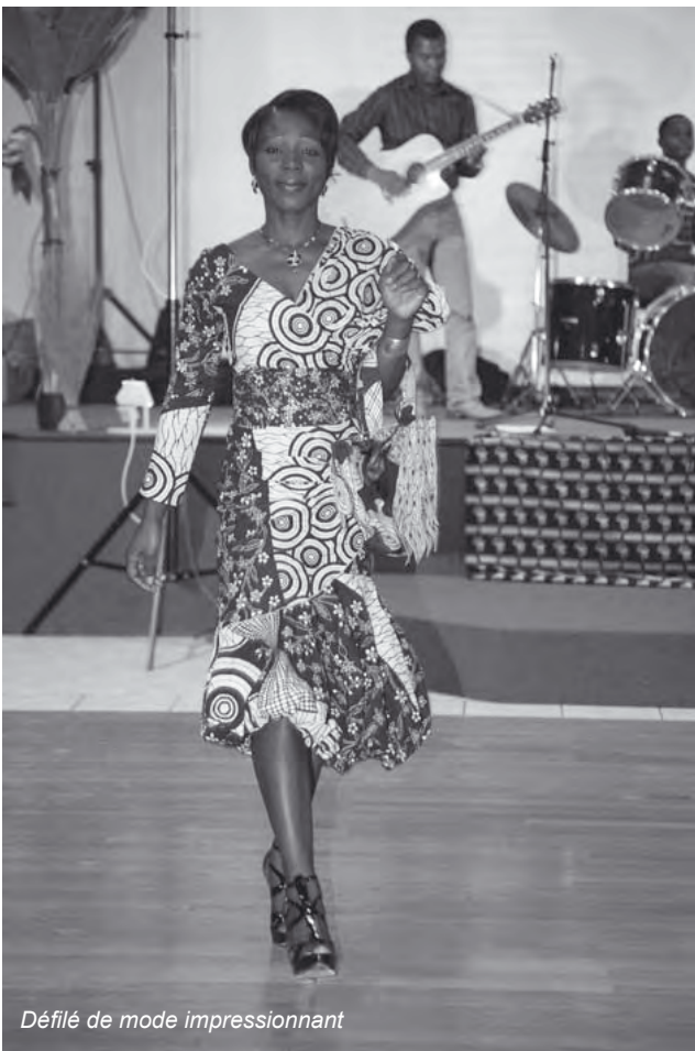
Défilé de mode impressionnant