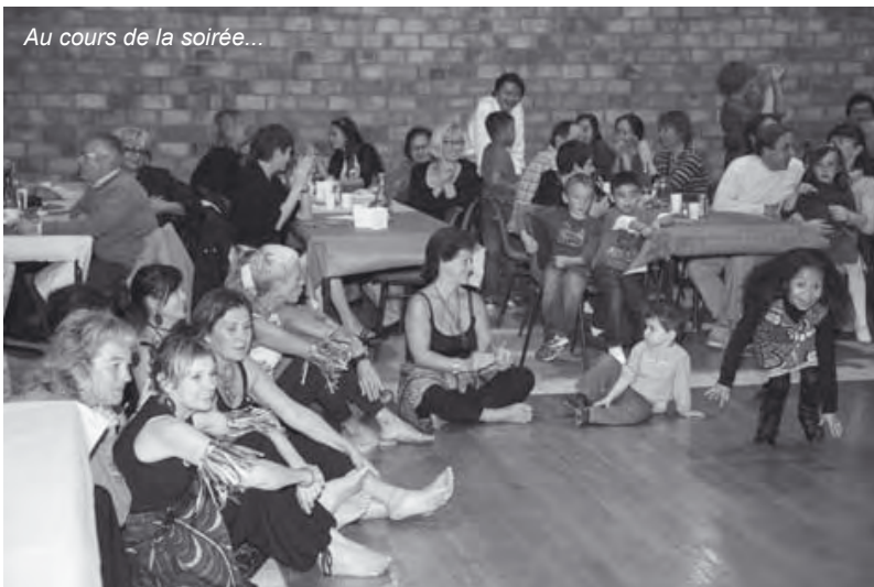
Au cours de la soirée...