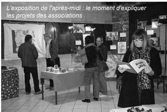
L'exposition de l'après-midi : le moment d'expliquer les projets des associations