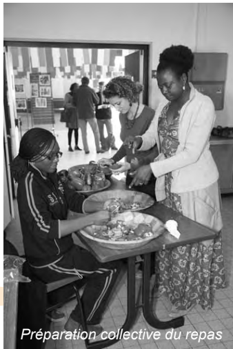
Préparation collective du repas