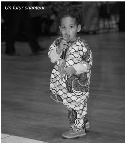
Un futur chanteur

Belle réussite pour la journée Kassumay du 6 novembre dernier !