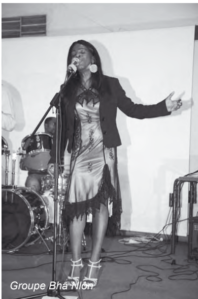
Groupe Bhá Nlón