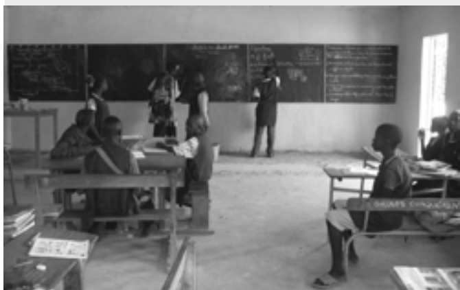
Classe de Bouyouye - pause récréation