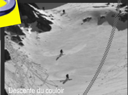
Descente du couloir