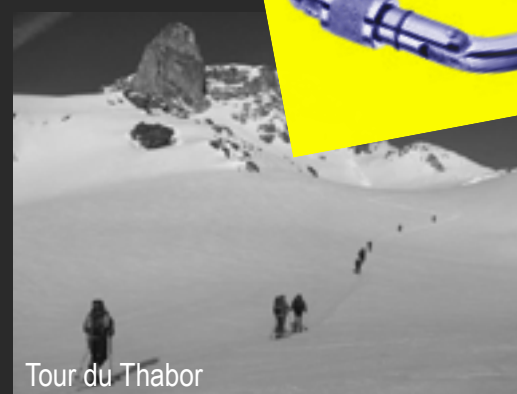
Tour du Thabor