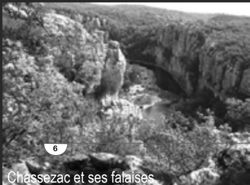
Chassezac et ses falaises