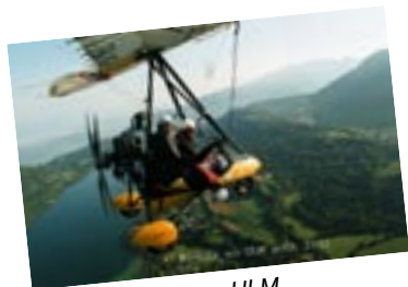
Une présidente en ULM