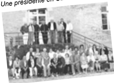
Le groupe en Arbois