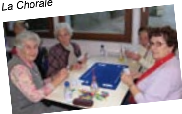
Partie de cartes