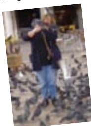
Venise : ses pigeons et ses gondoles